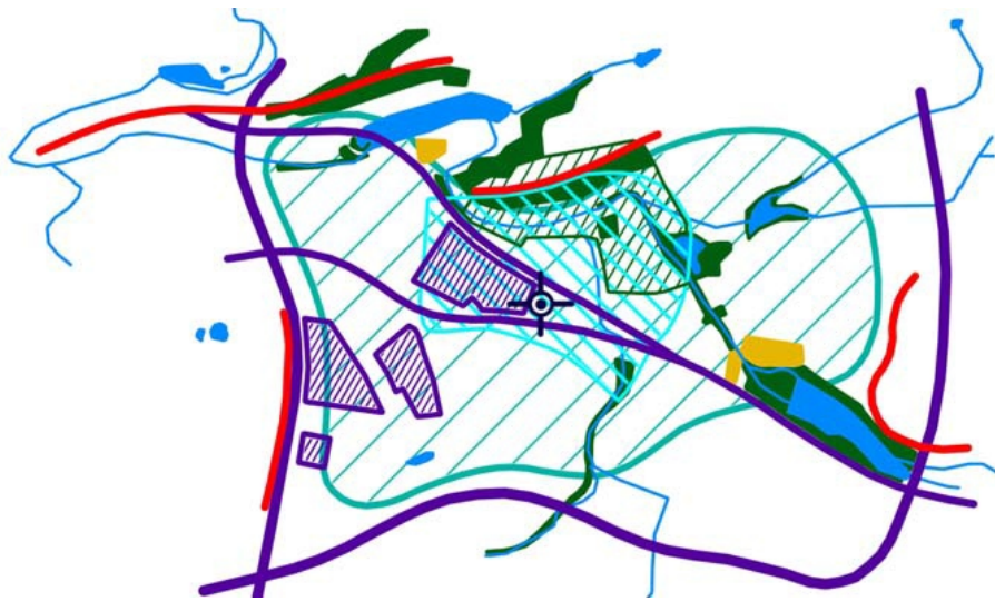
Obr. 13 s. 48