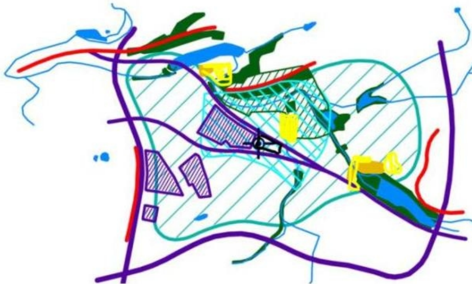
Obr. 13 ze s. 49 po opravě dle Obr. 3.2.11. Je patrné, že byla uměle podhodnocena velikost cenných lokalit zástavby - zcela vynechána navrhovaná památková zóna Hostavice, bezdůvodně zmenšena historická jádra Kyjí a Dol, Počernic. Plocha, která má být zastavěna navrhovanou stavbou, je ohraničena černě - umístění bodu v původním obrázku uměle budí dojem, že jde o stávající průmyslový areál.